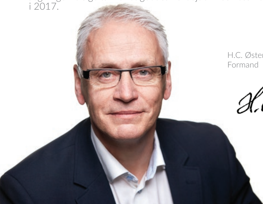
H.C. Østerby Formand

Jeg vil gerne sige tak for et godt samarbejde i Business Region MidtVest i 2017.